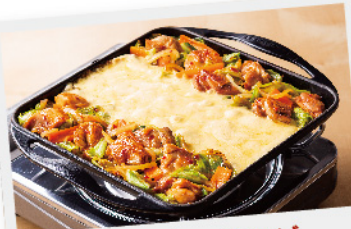
チーズタッカルビ