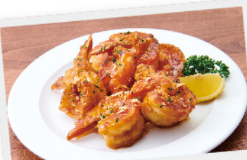
ガーリックシュリンプ