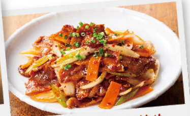
肉野菜ヤンニョム炒め