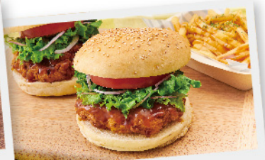
カンジャンチキンバーガー