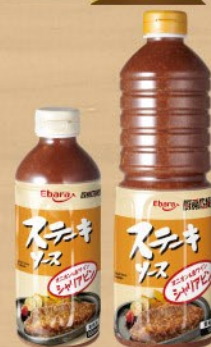
厨房応援団ステーキソース シャリアピン