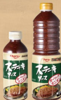
厨房応援団ステーキソース ガーリックオニオン