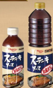
厨房応援団ステーキソース 和風おろし